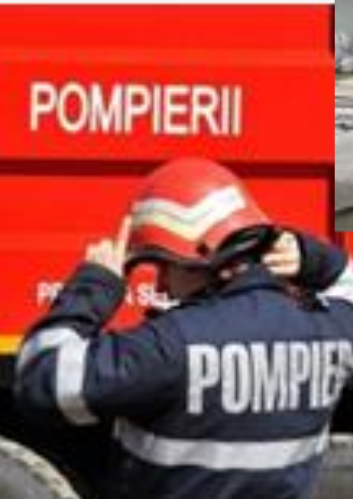
S.C. OCTOGON GAS&LOGISTIC S.R.L