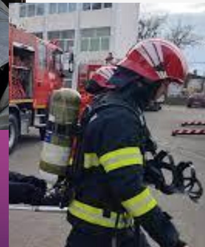
C.N.E. SUCURSALA CNE CERNAVODĂ