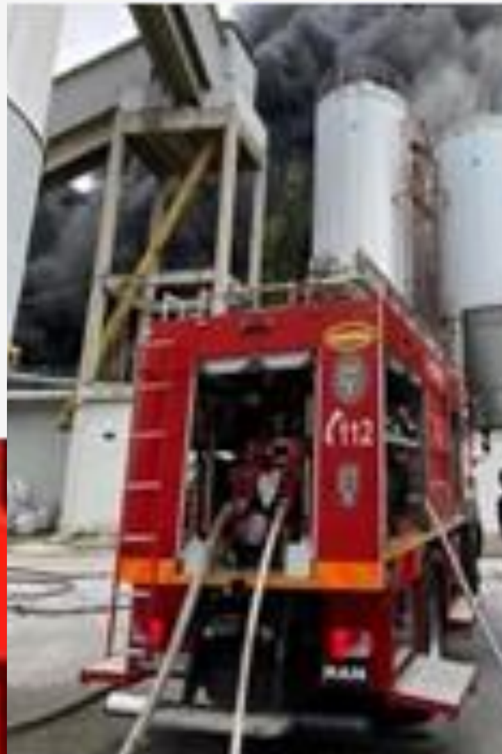
S.C. ARGUS S.A.