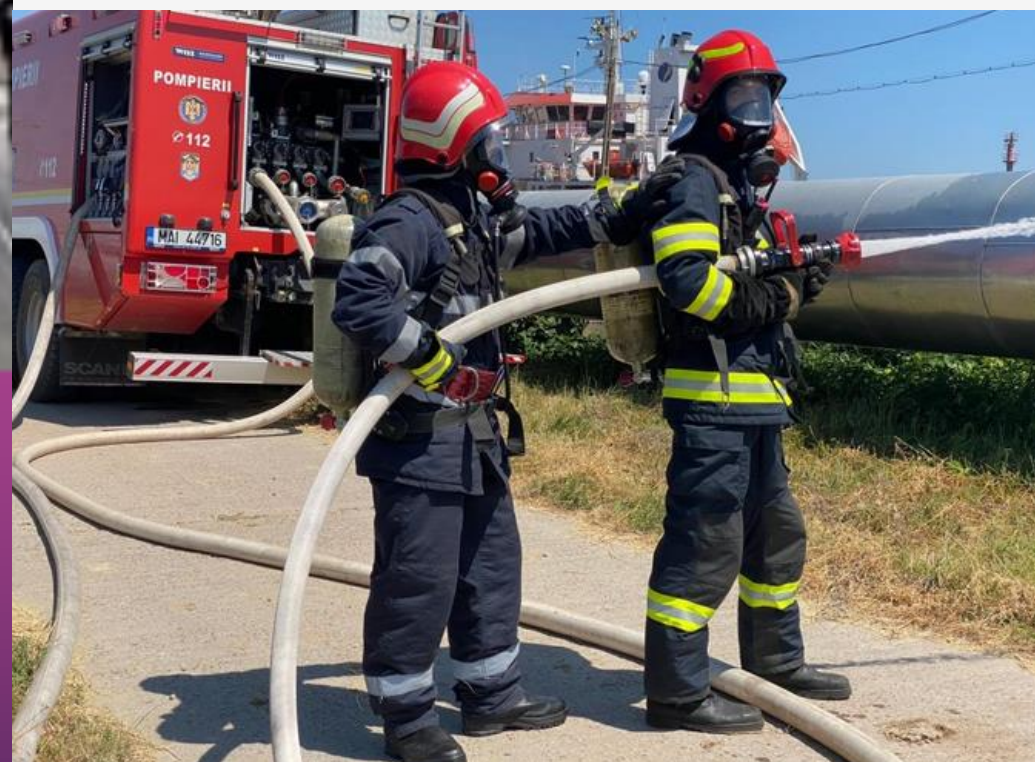
S.C. OIL TERMINAL S.A.