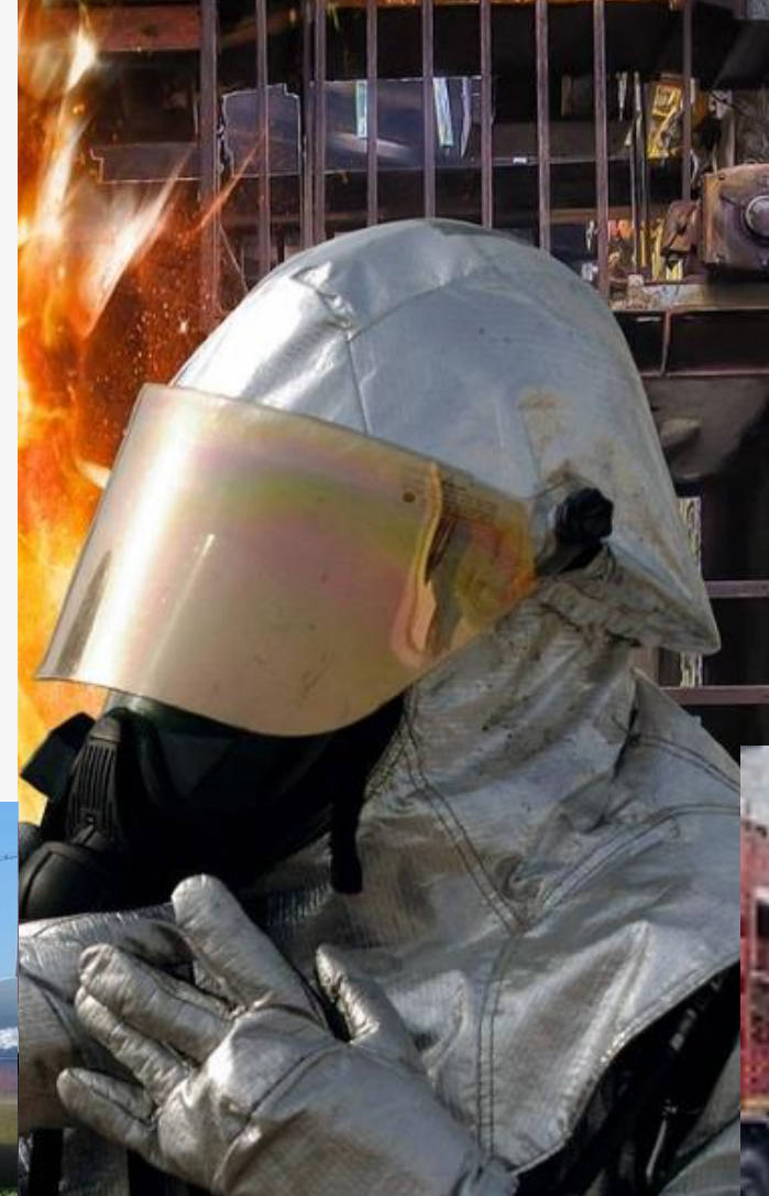
CALLATIS GAS S.R.L.